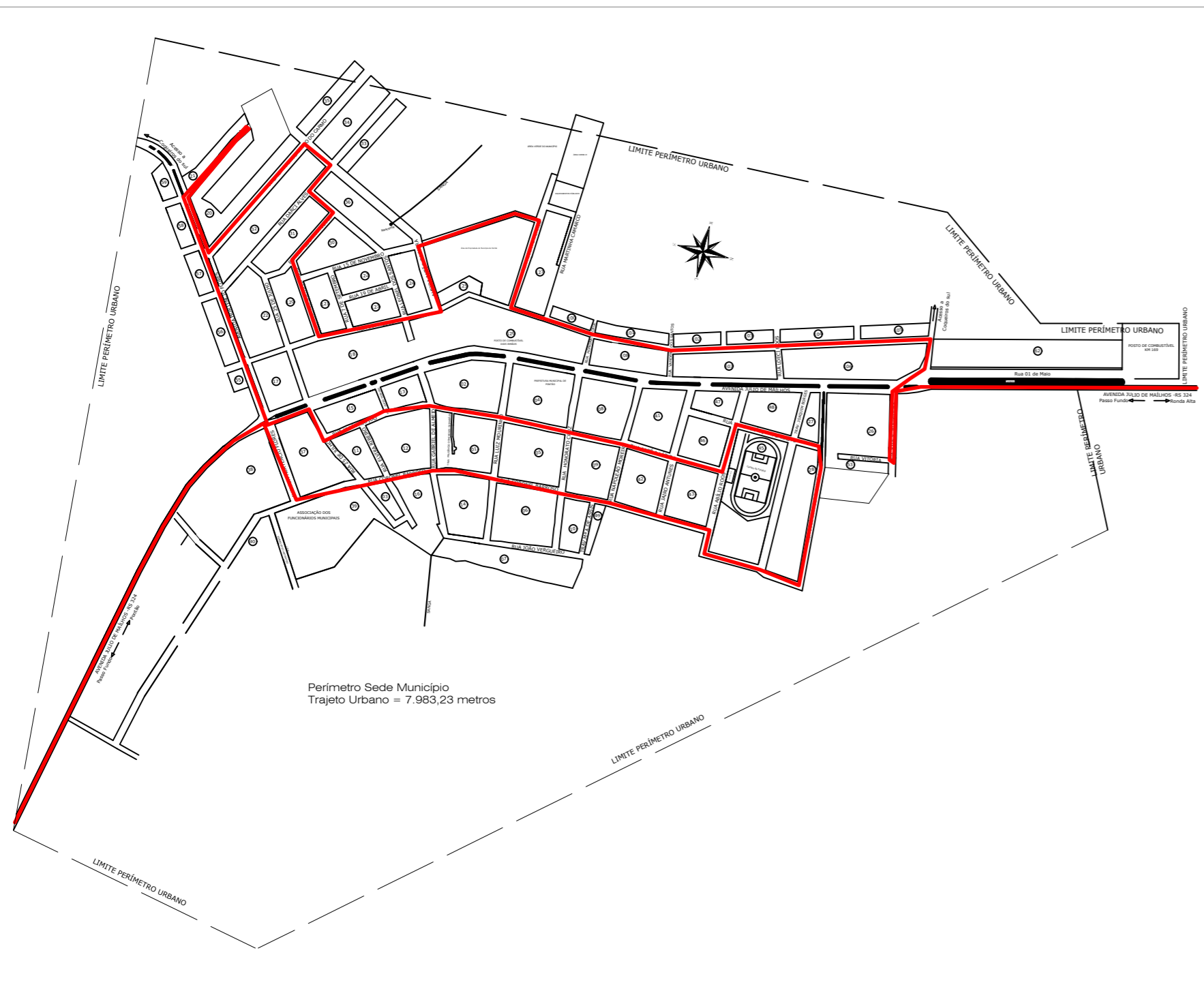
Coleta Seletiva Municipal