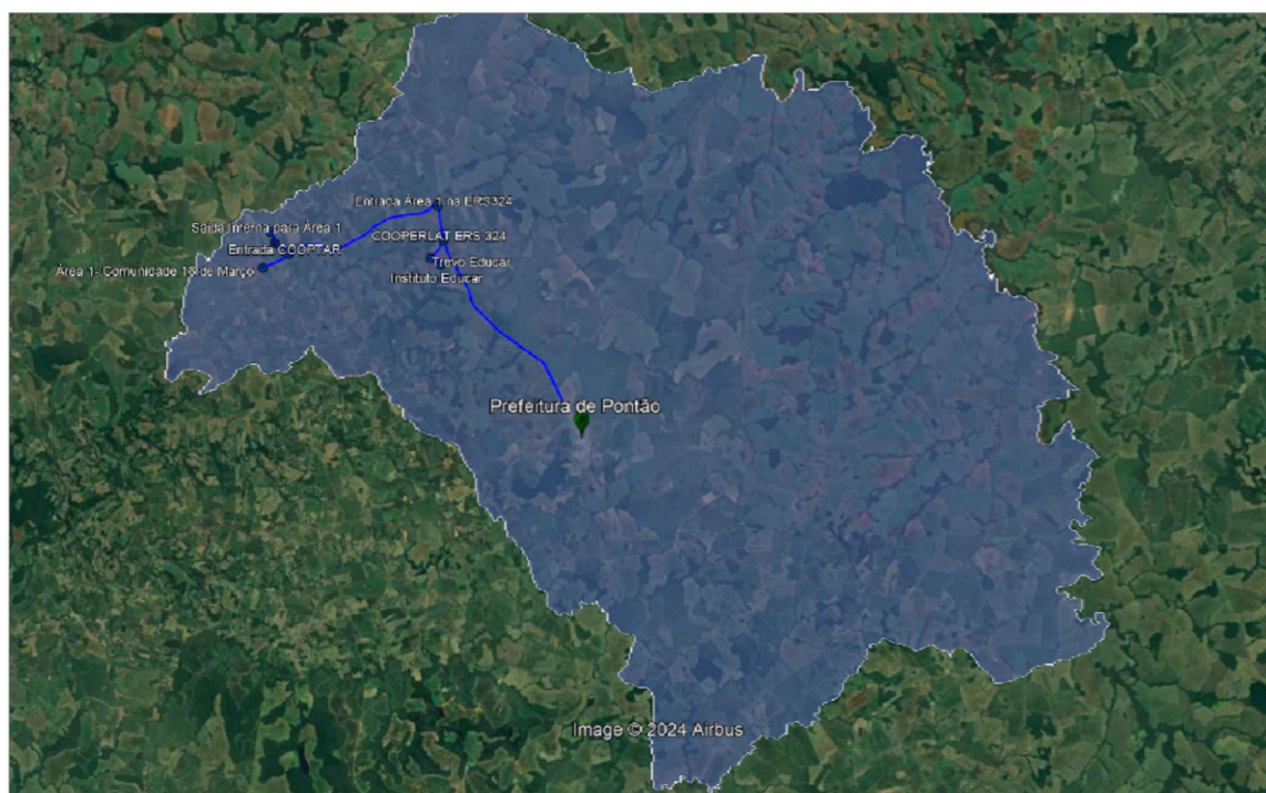
Roteiro 2 da Coleta Seletiva na Zona Rural