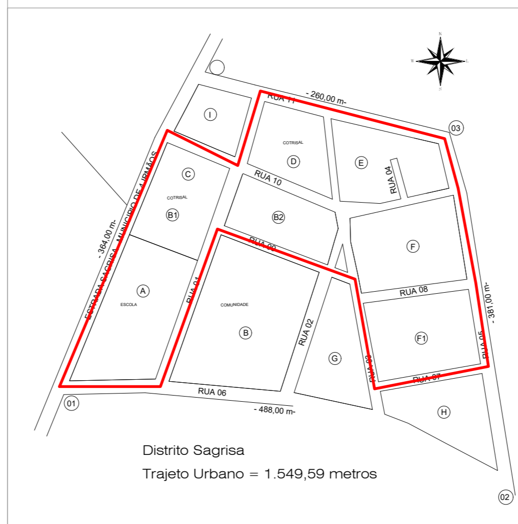
Distrito Sagrisa Trajeto Urbano = 1.549,59 metros